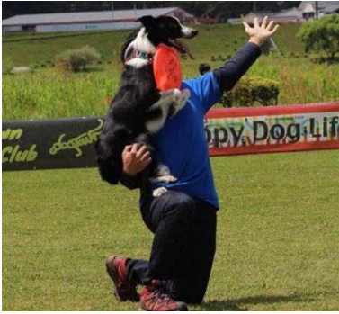
ドグタウン インビテーショナル 日本代表 Nanba & Alma