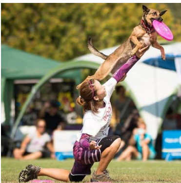
ドグタウン インビテーショナル 日本代表 Mona & Haribo European Championship 2017 Winner

It is dogsports that you can feel growing up with dog day by day. 愛犬と共に日々成長を感じられるドッグスポーツです。