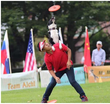
ドグタウン インビテーショナル 日本代表 Nanba & Sol DOG TOWN CUP 2017 Winner