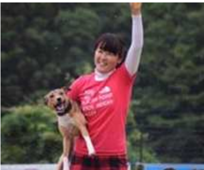
ドグタウン インビテーショナル 日本代表 Shimizu & Diesel