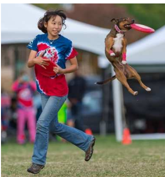
ドグタウン インビテーショナル 日本代表 Tsuda & Einstein

あらゆる年齢層が愛犬と生涯楽しめます。今すぐディスクを投げてみてください！新しい世界が広がります。